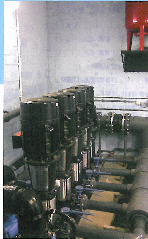
Warmtepompen, ook een optie.