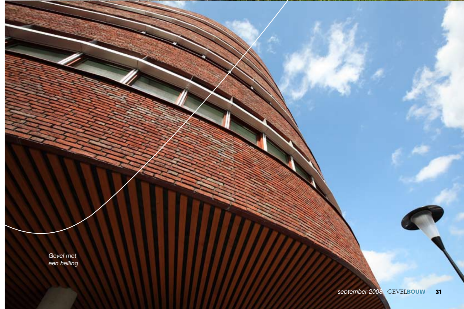
Gevel met een helling