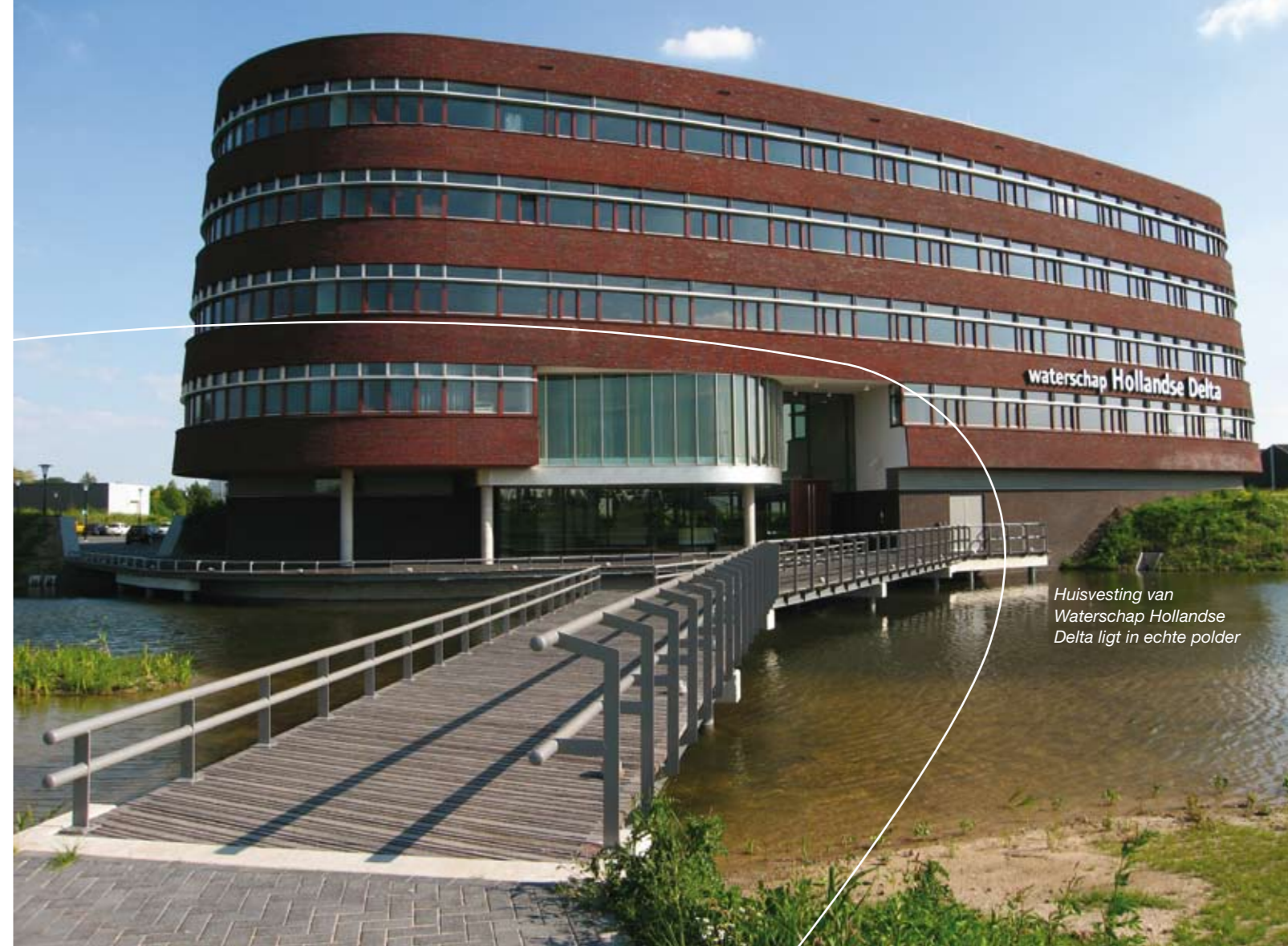
Huisvesting van Waterschap Hollandse Delta ligt in echte polder

EGM wierp een gebouw als een dam op en legde die in een driehoekige lus. Daarbinnen: een driehoekige binnenplaats. De plattegronden van de verdiepingen vormen zo het deltateken ( \Delta ). Om precies te zijn, een gebold deltateken, met bolle ribben en afgeronde hoeken. In de deltavorm zijn 300 activiteitgerelateerde werkplekken ondergebracht: 300 bureaus voor 350 medewerkers. De deltavorm bepaalt ook het gehele interieur. Het driehoekige atrium maakt de binnenzijde van het gebouw licht, luchtig en ruimtelijk. De binnengevel volgt wel de kromming maar niet de helling van de buitengevel en ook zijn de binnenhoeken niet afgerond. De binnenplaats is extra te beleven door een ruime trap. Hout en gedempte kleuren maken het atrium intiem. De eerste verdiepingvloer bevat het bedrijfsrestaurant en is grotendeels gesloten zodat het atrium kan worden benut voor grote bijeenkomsten. Het maaiveld loopt door onder het grootste deel van het gebouw. Hier parkeren medewerkers en bezoekers.