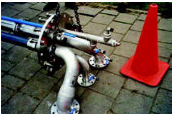
Opbouw warme bron

RCC Total Energy – Schoon & zuinig koelen en verwarmen