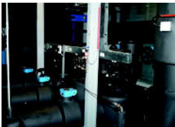
Pompen en kleppen driedubbel uitgevoerd

in bedrijf. Daarbij wordt koud grondwater van circa 8,0°C uit de koude bron gepompt. Deze koude wordt via de TSA afgegeven aan het gekoeldwatercircuit met de energieopslag. Door het koelen stijgt de temperatuur van het grondwater tot circa 16°C. Het grondwater wordt vervolgens in de warme bronnen geïnjecteerd.