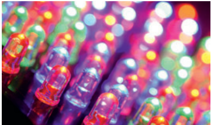
Verwacht wordt dat de ontwikkeling van ledlichtbronnen een snelle opmars zal maken.